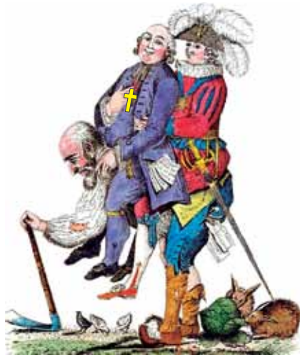
( As três ordens , 1789. http://online-lernen.levrai.de )

A charge ilustra as três ordens sociais existentes na França antes da Revolução de 1789. Identifique essas três ordens e justifique o posicionamento dos personagens na charge.